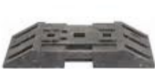
Beispiel für Bakenfüße