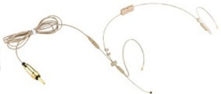
Beispiel für Microphone